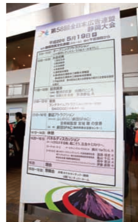
当日のタイムスケジュール看板