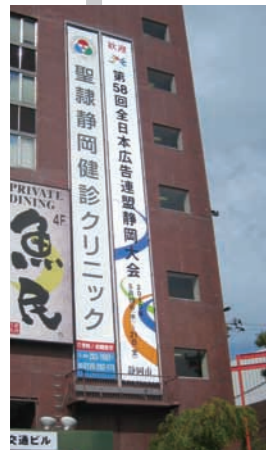
静岡駅前に掲げられた 歓迎の懸垂幕