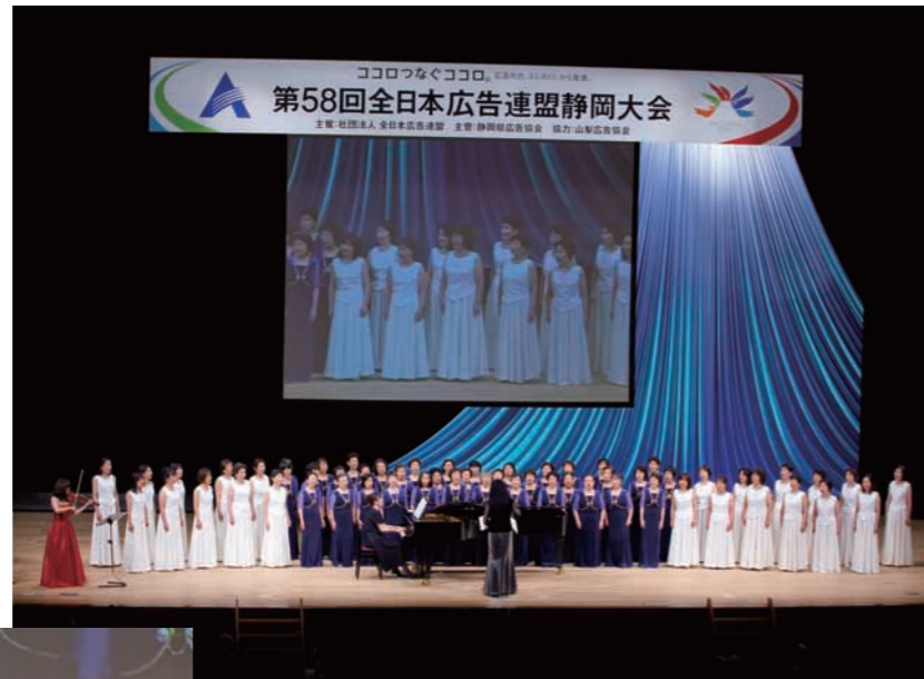
「ふじの山」の美しいハーモニーで会場を魅了しました

両団体とも、「第32回全日本おかあさんコーラス全国大会(2009年愛媛県松山市)」に出場。