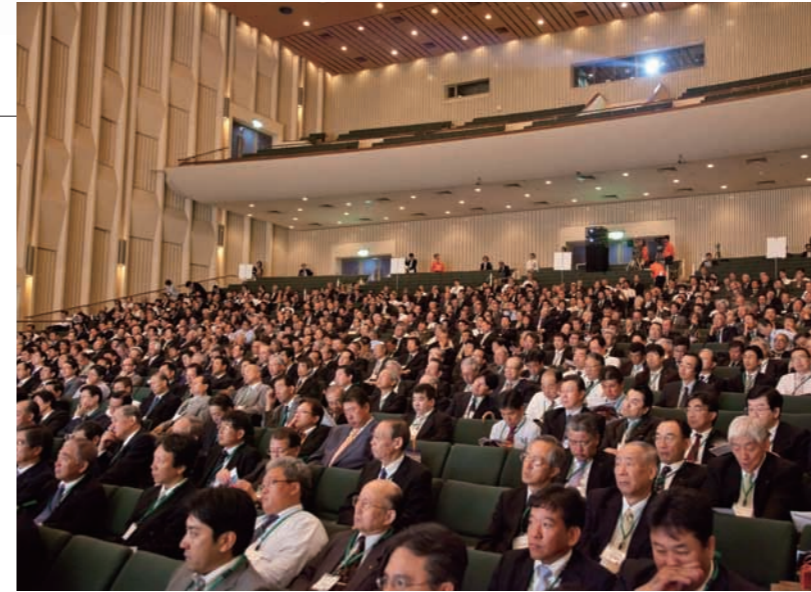
記念講演やパネルディカッションを熱心に聞き入る参加者たち