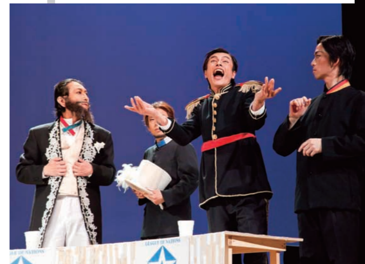
戯曲「ペール・ギュント」の1シーン