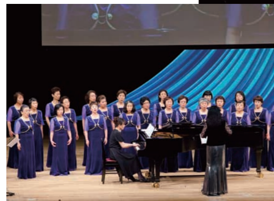
静岡レディスコーラス