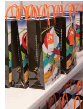
受付でネームカードと 資料を受け取る