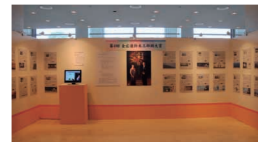
鈴木三郎助大賞授賞作品 「古典をいただき 古典に抱かれてキャンペーン」等を展示