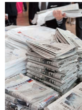
大会を特集した新聞も配布された