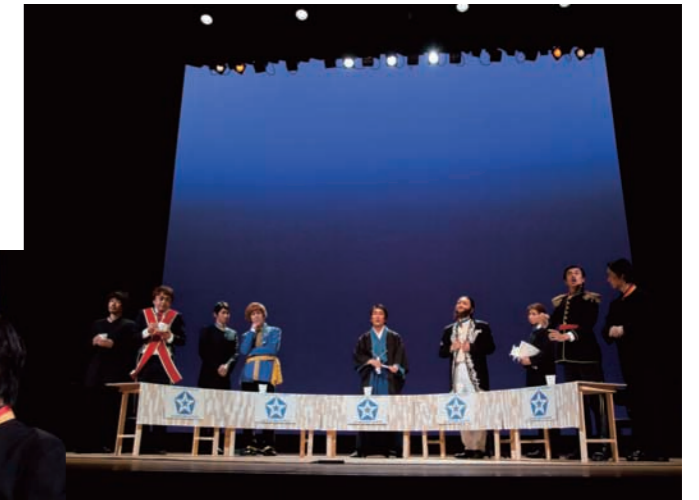
SPACによる歓迎アトラクション

(財)静岡県舞台芸術センター(Shizuoka Performing Arts Center:SPAC)は、専用の劇場や稽古場を拠点として、専属の俳優、専門技術スタッフが活動を行なう日本で初めての公立の文化事業集団です。今回は、芸術総監督宮城聡の演出による演劇「ペール・ギュント」の名場面を上演。専属俳優たちによる楽器の生演奏を含め迫力ある舞台が繰り広げられました。