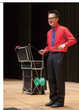
ダメじゃん小出氏