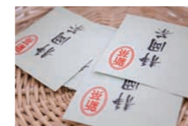
茶処・静岡の煎茶