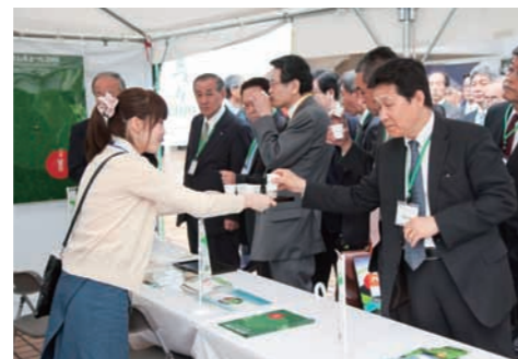
静岡茶の新茶もふるまわれた