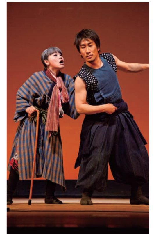
熟演する俳優は地元静岡に住む「身近な」存在