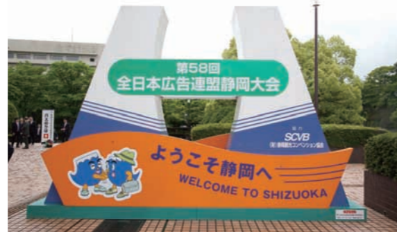
富士山、お茶、みかん、駿河湾をイメージした歓迎モニュメント