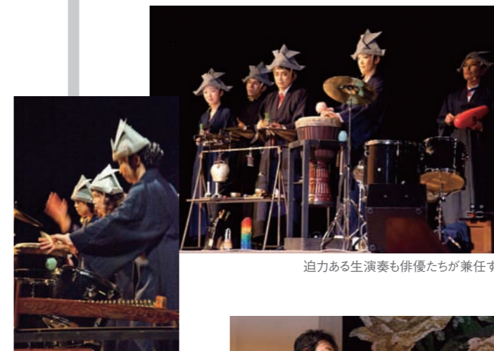
迫力ある生演奏も俳優たちが兼任する