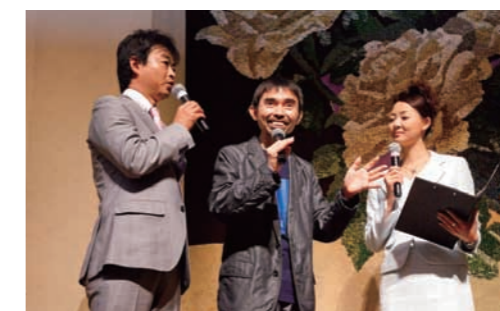
「舞台芸術のすそ野を広げたい」と話す宮城聡芸術総監督