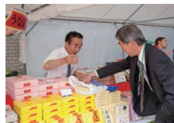
静岡県のお土産コーナー