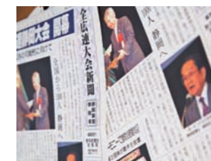
お昼には当日の号外も配られた