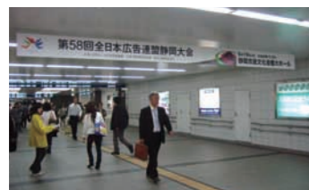
静岡駅前地下道の会場案内看板